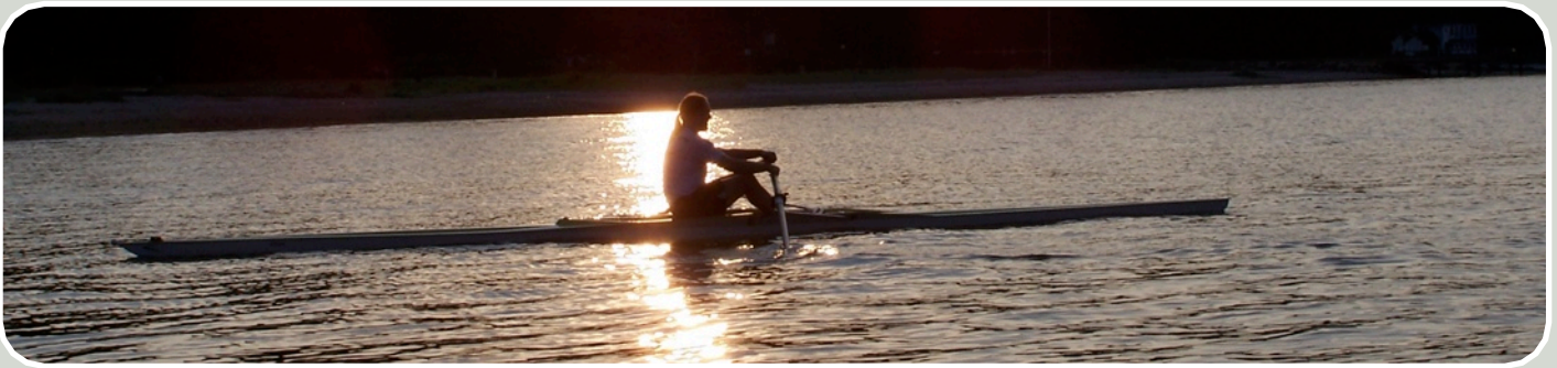
Rudern auf der Flensburger Förde.