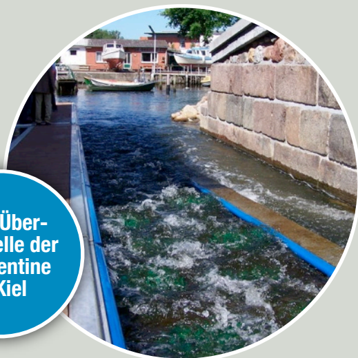
neue Übersetzstelle der Schwentine in Kiel